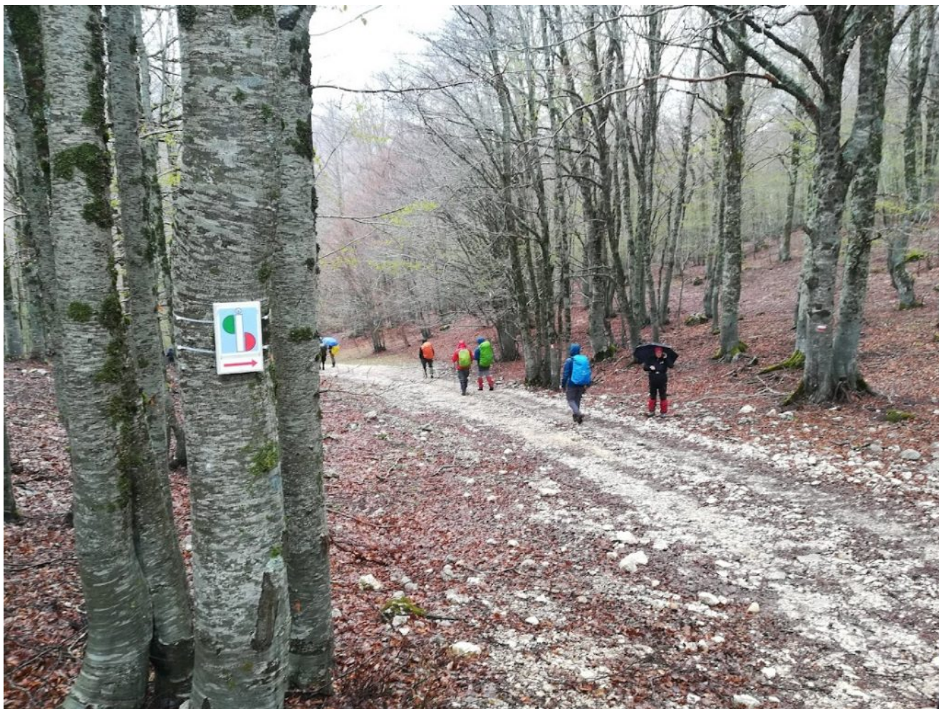
Altopiani Maggiori d'Abruzzo