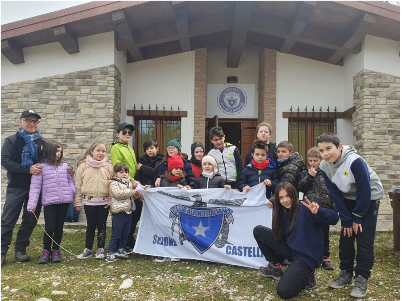
Rifugio Enrico Faiani A presidio della Montagna

Castelli difende il proprio territorio che appartiene alla sua popolazione montana ed a quanti vivono stabilmente in esso e vogliono continuare a viverci. Curando l'ambiente che ha ispirato e continua a ispirare i pregevoli decori della ceramica, si accrescono anche le risorse socio-economiche della cittadina con il suo stuolo di valenti artigiani.