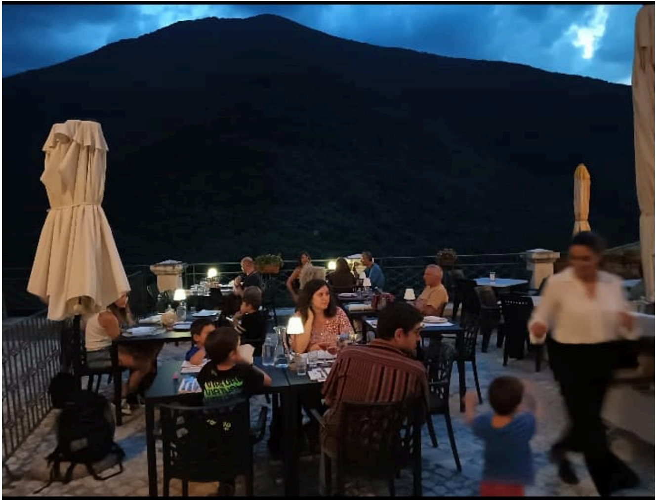
La magia antica di Pettorano sul Gizio rivela gustosi segreti.